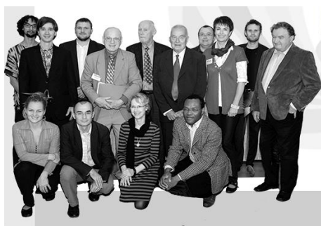
Společná fotografie účastníků ustavujícího shromáždění (Plzeň, 2013)