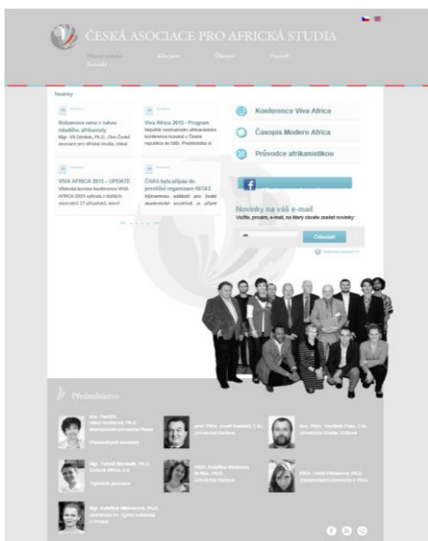
Náhled úvodní webové stránky České asociace pro africká studia.